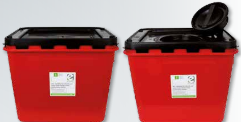
Variante mit Standarddeckel

Die Abfälle werden über die verkleinerte runde Öffnung in der Mitte eingeworfen. Diese Öffnung kann mit dem Zwischendeckel jederzeit verschlossen werden.